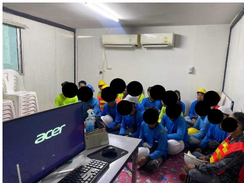
รูปที่ 11 จัดอบรมให้ความรู้พนักงาน