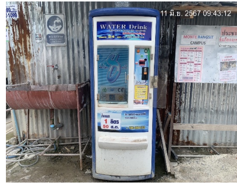
รูปที่ 12 บ้านพักคนงานและสิ่งอำนวยความสะดวก (ต่อ)