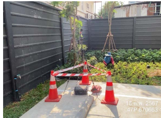
รูปที่ 6 ติดตั้งเครื่องตรวจวัดคุณภาพสิ่งแวดล้อม