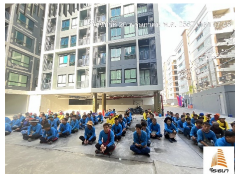
รูปที่ 7 กิจกรรม Safety talk