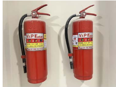
รูปที่ 10 ถังดับเพลิง