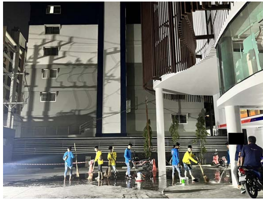
รูปที่ 5 คนงานทำความสะอาดบริเวณพื้นที่โครงการ