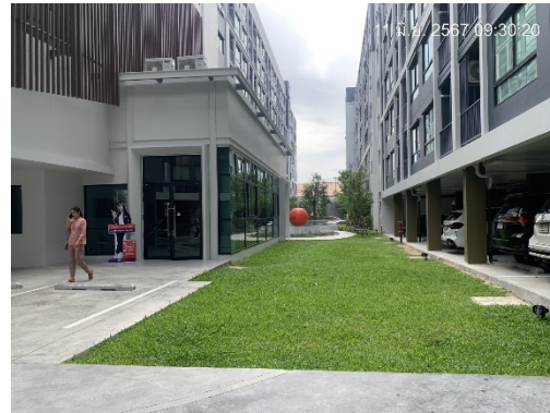
รูปที่ 18 พื้นที่สีเขียวของโครงการ