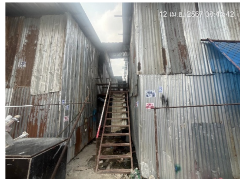
รูปที่ 12 บ้านพักคนงานและสิ่งอำนวยความสะดวก