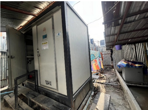
รูปที่ 13 ห้องน้ำคนงาน