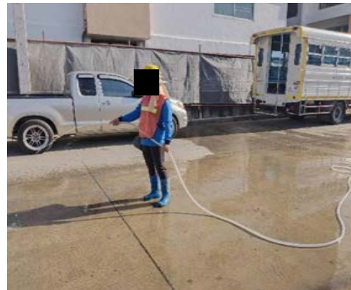
รูปที่ 4 กิจกรรมฉีดพรมน้ำ