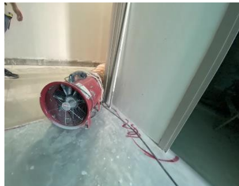
รูปที่ 16 พัดลมระบายอากาศ ทำงานในพื้นที่อับอากาศ