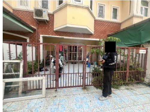
รูปที่ 1 เจ้าหน้าที่โครงการเข้าพบบ้านพักอาศัยข้างเคียง