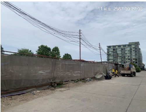
รูปที่ 2 พื้นที่สำหรับกองวัสดุก่อสร้าง