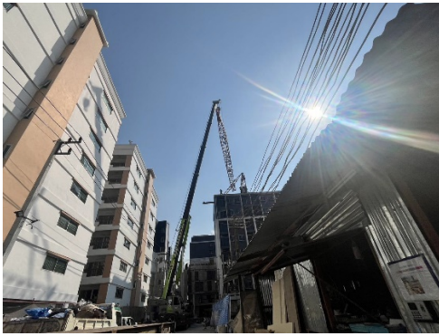
รูปที่ 17 การควบคุมแซนเครนไม่ให้ล้ำพื้นที่ก่อสร้าง