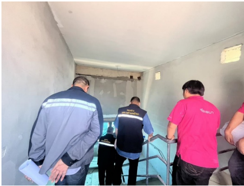
รูปที่ 19 การตรวจสอบอาคารของหน่วยงานราชการ