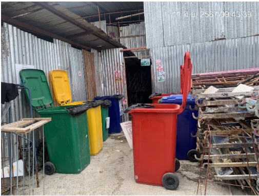
รูปที่ 8 ถังรองรับขยะมูลฝอย ของโครงการและบ้านพักคนงาน