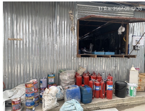
รูปที่ 3 พื้นที่เก็บวัสดุห้องสโตร์